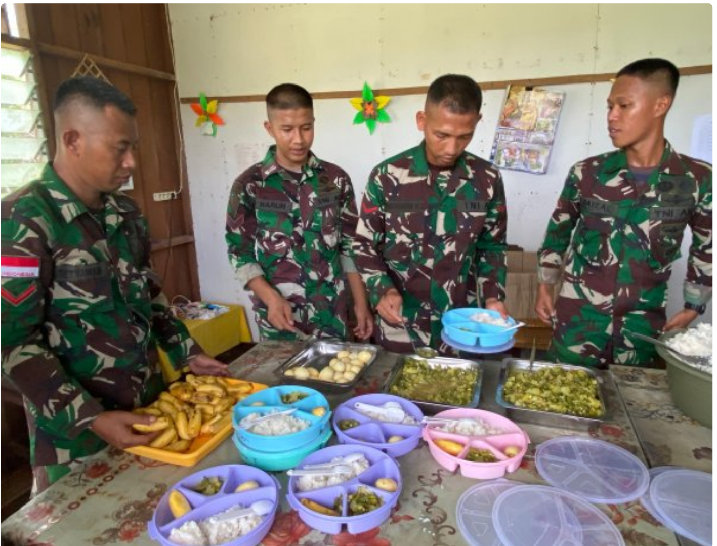
Foto: Dedikasi Satgas Pamtas Mobile RI-PNG Yonif 503/Mayangkara dalam mendukung program makan bergizi gratis pemerintah mendapat apresiasi tinggi dari masyarakat Distrik Krepkuri, Kabupaten Nduga, Papua, di sekolah rimba, Rabu (29/01/2025).

NDUGA- Dedikasi Satgas Pamtas Mobile RI-PNG Yonif 503/Mayangkara dalam mendukung program makan bergizi gratis pemerintah mendapat apresiasi tinggi